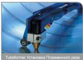
Tubeformer Установка Плазменного реза

Уникальная конструкция не только соответствует требованиям специализированных проектов изготовления систем вентиляции и кондиционирования, но и потребностям в уникальных спирально-навивных воздуховодах, используемых в других отраслях, в основном, в строительстве и горнодобывающей промышленности.